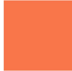
Orange HEX #f97743